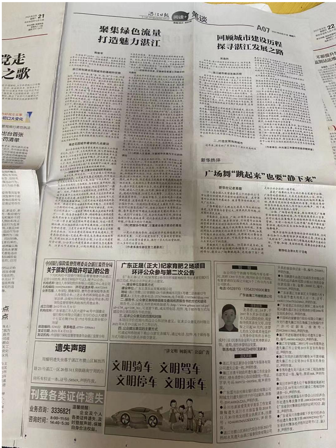
图3 湛江日报 2021年8月21日公示照片

广东正晟（正大）纪家育肥2场项目环境影响报告书征求意见稿报纸公示通过湛江日报公开征求意见，湛江日报为建设项目所在地公众易于接触的报纸，符合《环境影响评价公众参与办法》的要求。报纸名称为湛江日报，公示时间为2021年8月21日、2021年8月22日，连续登报2次，报纸公示照片见下图3~图4。