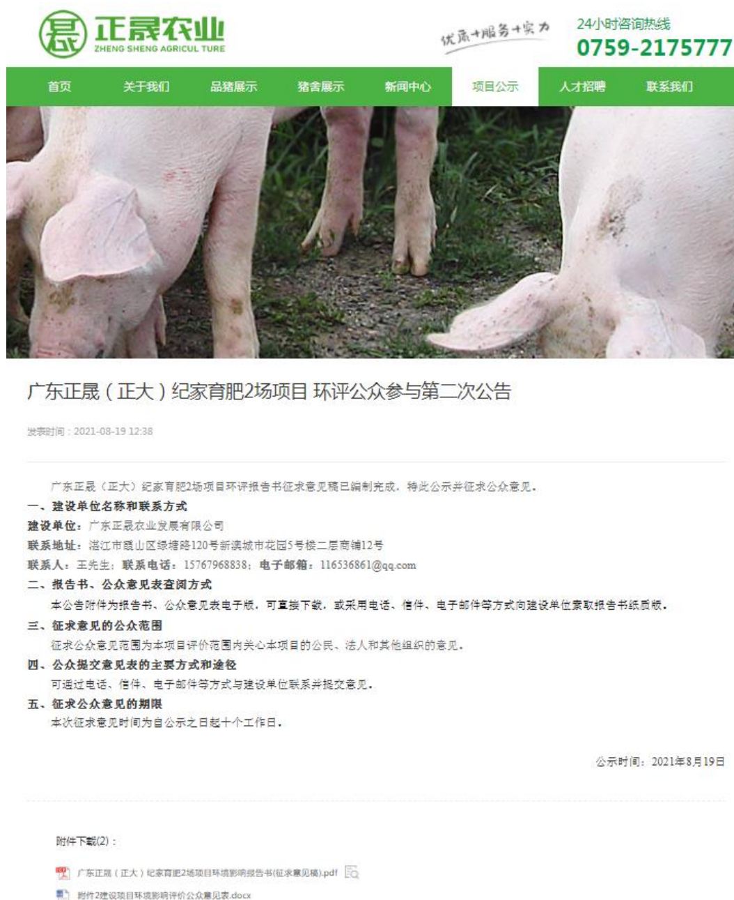
图2 征求意见稿公示截图

广东正晟（正大）纪家育肥2场项目环境影响报告书征求意见稿网络公示通过广东正晟农业发展有限公司官方网站公开征求意见，符合《环境影响评价公众参与办法》的要求。网络公示时间为2021年8月19日至2021年9月1日共10个工作日，网址为 http://www.gdzsny.net/nd.jsp?id=17#_np=108_361 ，截图见下图2。