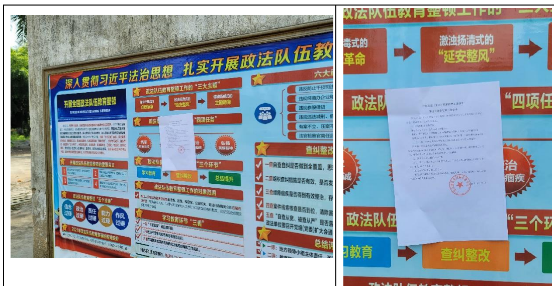
河头镇张贴公示照片