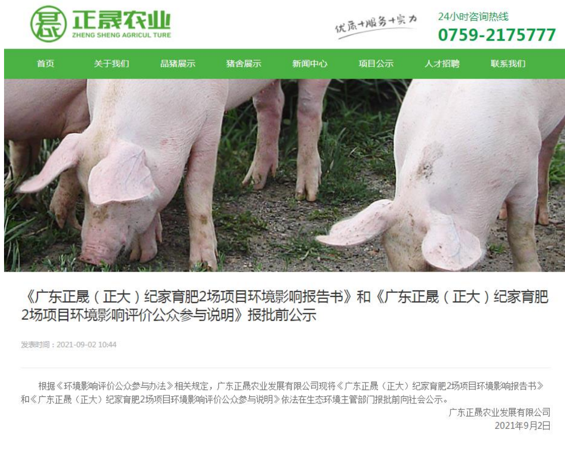
图 6 报批前公示截图