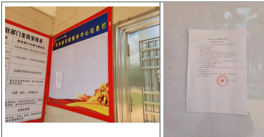
纪家镇张贴公示照片

月19日至2021年9月1日共10个工作日，地点为纪家镇政府、江洪镇政府、河头镇政府、纪家镇先锋村委会，张贴公示照片见下图。