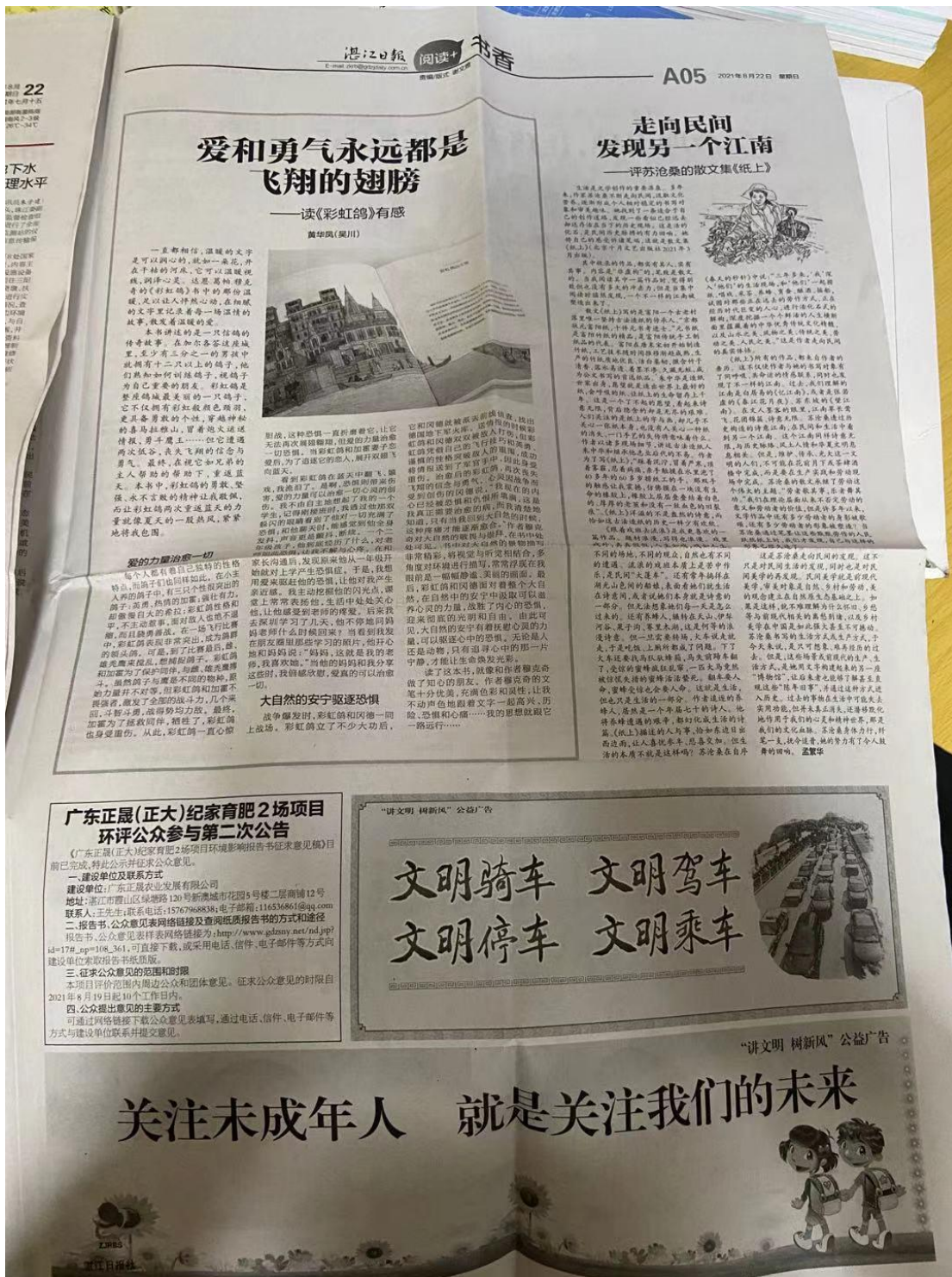
图4 湛江日报 2021年8月22日公示照片