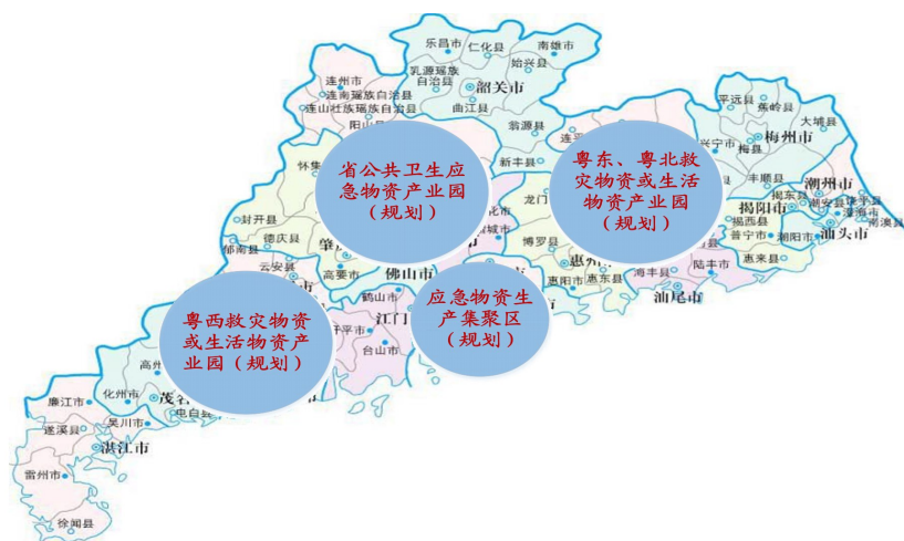
图1 产业园、产业集聚区规划示意图

推进应急物资产业基地建设。注重产储结合，优化产能布局，充分发挥制造业大省优势，培育若干个综合性、专业性应急物资产业园。发挥骨干企业、高新技术企业引领带动作用，打造应急物资全产业链，形成集聚效应。