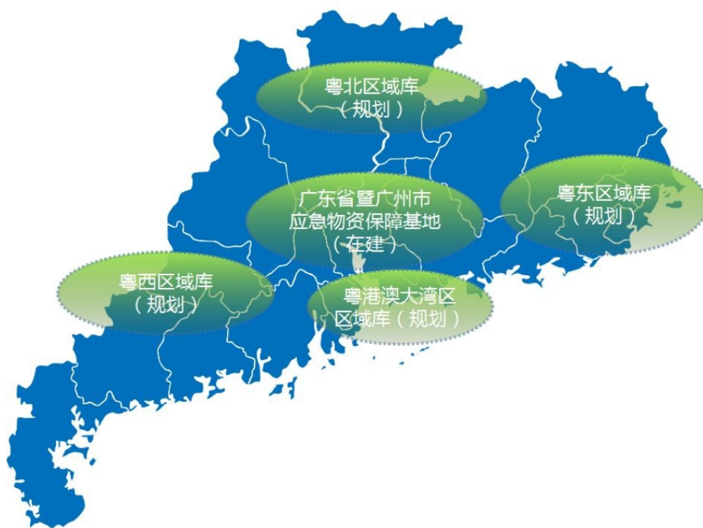
图3 省级应急物资保障基地、区域库布局示意图

统筹仓储设施建设布局。根据各地地理气候、人口规模、经济发展、产业结构的差异，统筹全省各级应急物资仓储设施建设布局，实现不同区域、不同品类物资差异化保障。在粤港澳大湾区重点区域以及多灾易灾、偏远地区推进综合性应急物资区域库建设，强化区域辐射效应，提升应急响应效率。