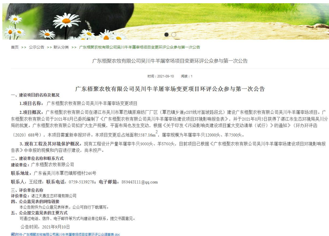
图1 首次网络公示截图

广东梧聚农牧有限公司吴川牛羊屠宰场变更项目首次环境影响评价信息公开方式采取网络公示，通过广东梧聚农牧有限公司网站进行公示，广东梧聚农牧有限公司网站为建设单位网站，符合《环境影响评价公众参与办法》的要求。网络公示时间为2021年9月10日，网址为 http://www.gdwjnm.com/gdwjnm/vip_doc/21714493.html ，截图见下图1。