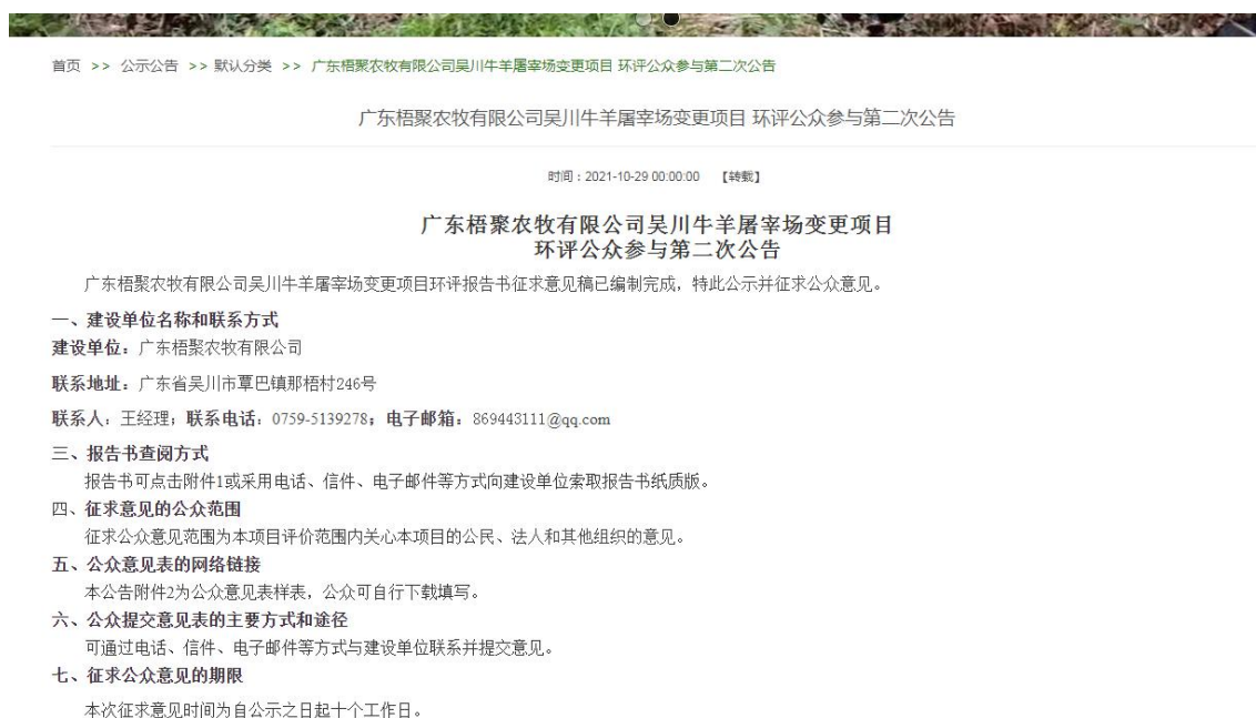
图2 征求意见稿公示截图

广东梧聚农牧有限公司吴川牛羊屠宰场变更项目环境影响报告书征求意见稿网络公示通过广东梧聚农牧有限公司网站公开征求意见，广东梧聚农牧有限公司网站为建设单位公司网站，符合《环境影响评价公众参与办法》的要求。网络公示时间为2021年10月29日至2021年11月11日共10个工作日，网址为 http://www.gdwjnm.com/gdwjnm/vip_doc/21865696.html ，截图见下图2。