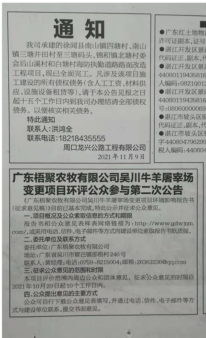
图3 湛江日报 2021年11月9日公示照片