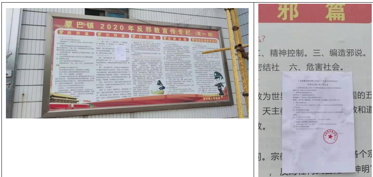
覃巴镇张贴公示照片