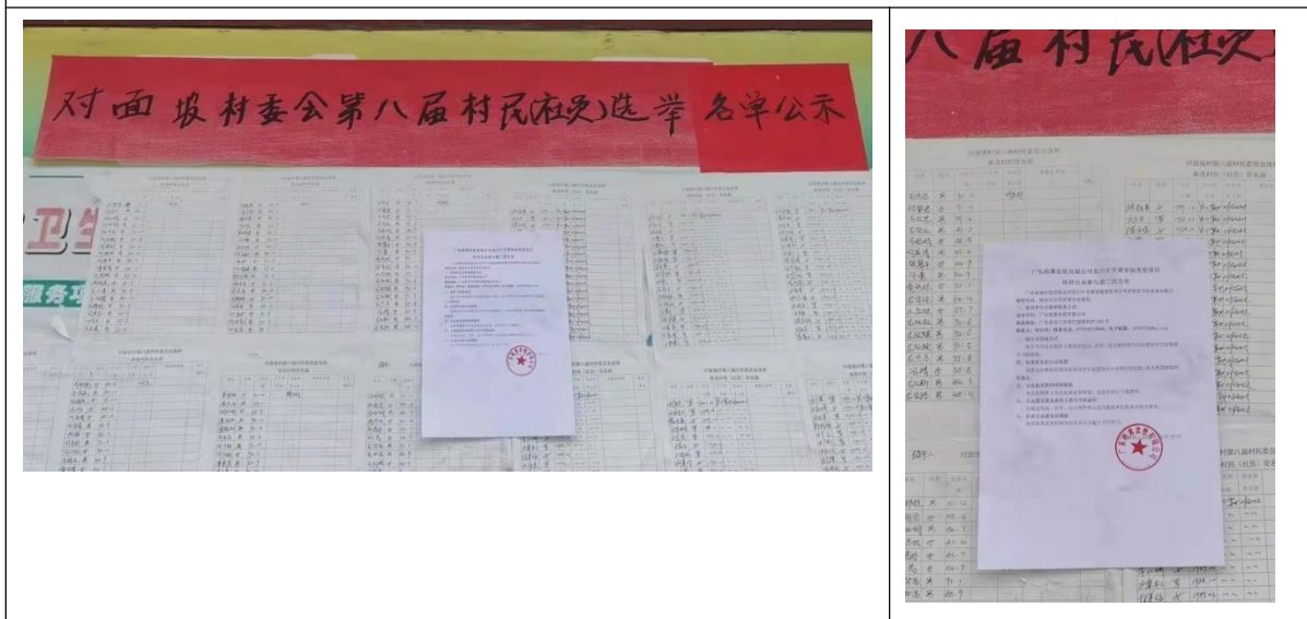
对面坡村张贴公示照片