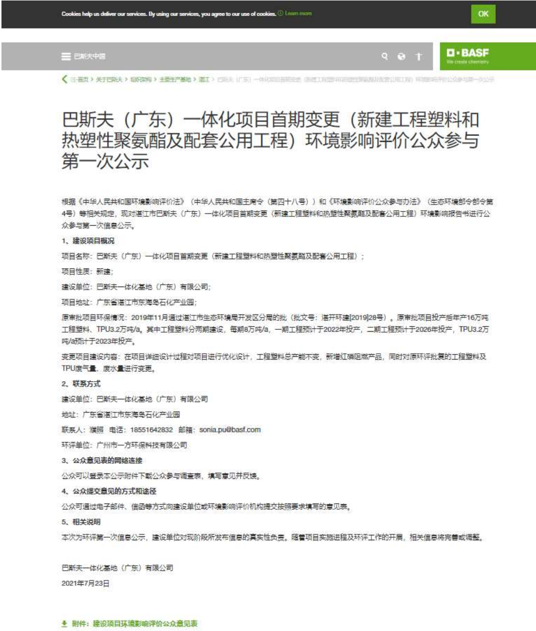
图 2.2-1 第一次环评公示网上截图

本项目于2021年7月23日在公司官网上（ https://www.basf.com/cn/zh/who-we-are/organization/key-production-sites/guangdong.html ）进行了网上信息公示，至提交报告书时仍可浏览。第一次公示网上截图见图2.2-1。