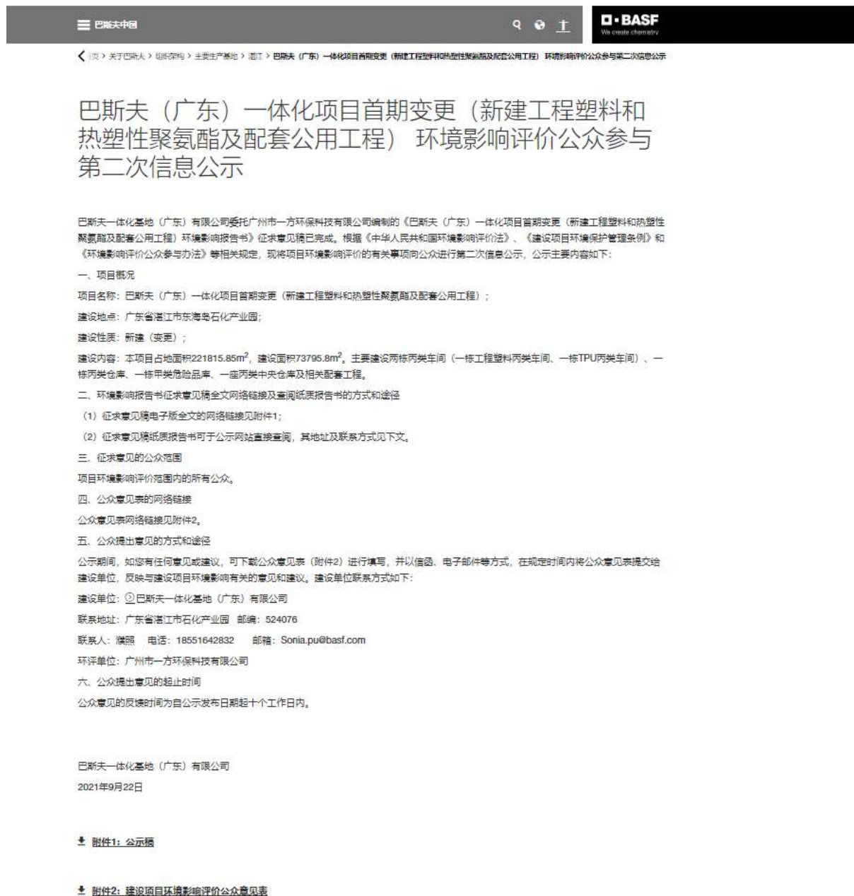
图 3.2-1 第二次网上公示截图

本项目于 2021 年 9 月 25 日在《湛江日报》报纸首次刊登征求意见稿公示信息，于 2021 年 9 月 29 日在《湛江日报》再次刊登征求意见稿公示信息，具体见图 3.2-3。