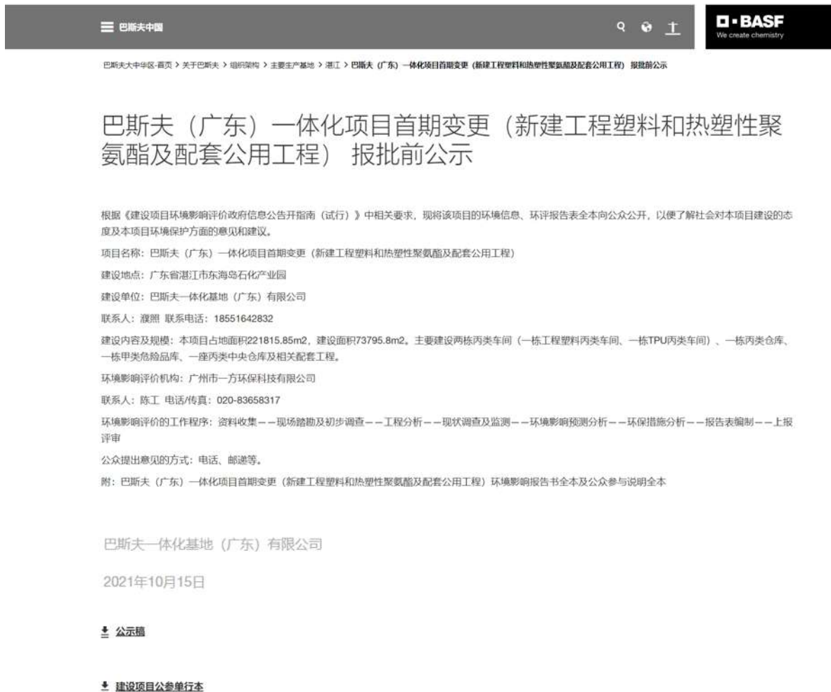
图 6.1-1 项目报批前公开网络公示截图