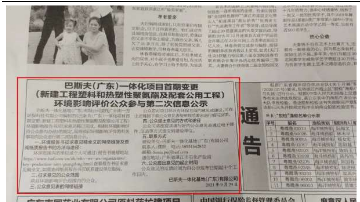
2021年9月29日《湛江日报》第二次公示