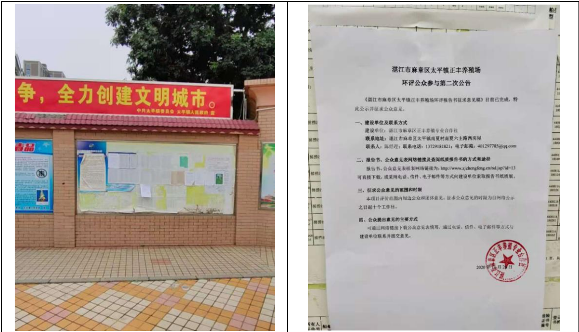
太平镇镇政府张贴公告照片