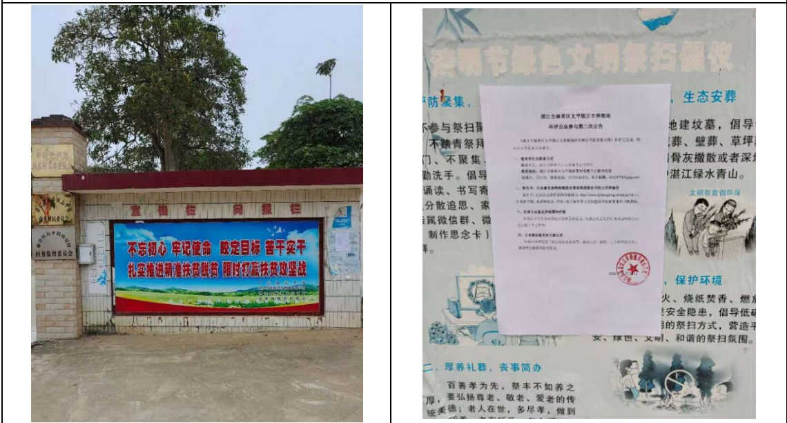
南夏村村委会张贴公告照片