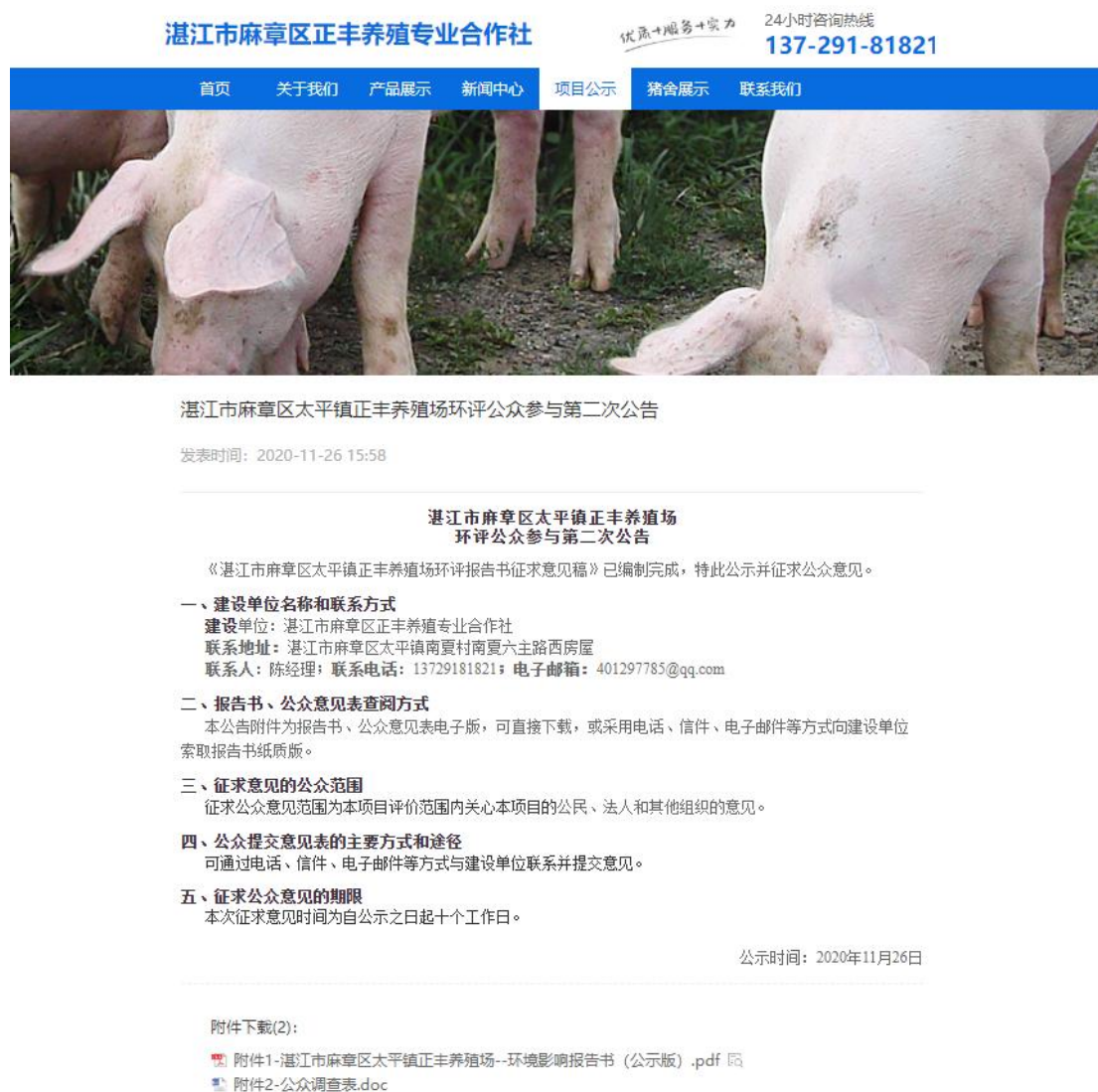
图2 征求意见稿公示截图

湛江市麻章区太平镇正丰养殖场环境影响报告书征求意见稿网络公示通过湛江市麻章区正丰养殖专业合作社网站公开征求意见，湛江市麻章区正丰养殖专业合作社网站为建设项目所在地相关政府网站，符合《环境影响评价公众参与办法》的要求。网络公示时间为2020年11月26日至2020年12月9日共10个工作日，网址为 http://www.zjzhengfeng.cn/nd.jsp?id=13#_np=108_370 ，截图见下图2。