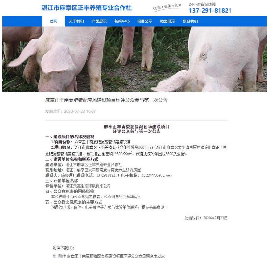
图 1 首次网络公示截图