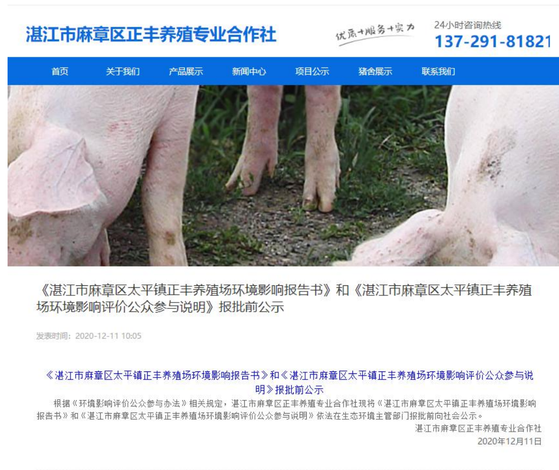
图 6 报批前公示截图