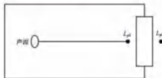
图 B.1 室内声源等效为室外声源图例