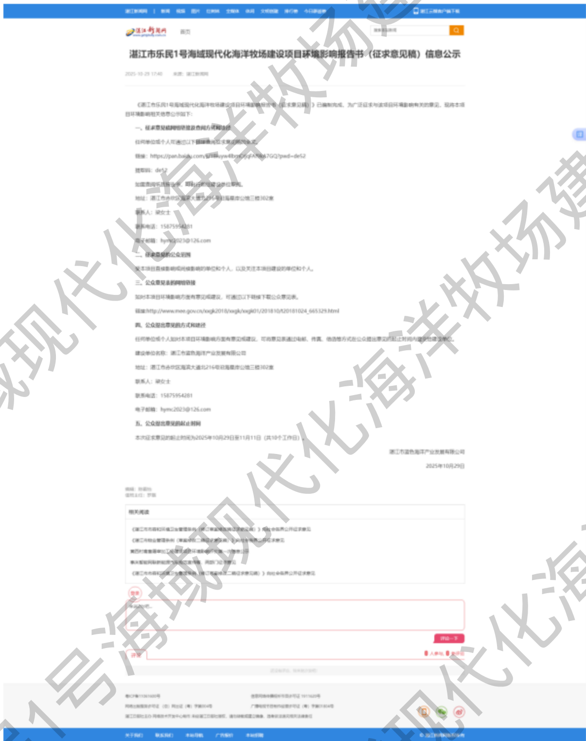
图 3-1 征求意见稿环境影响评价信息公开网上截图