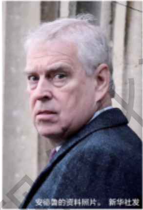
安德鲁的资料照片。

美国已故富商杰弗里·爱泼斯坦所涉性犯罪丑闻持续发酵，不仅成为美国党争焦点，英国国王查尔斯三世的弟弟安德鲁也因牵涉其中被剥夺王室头衔和待遇，而此前的“麻烦”还没结束：美国国会众议院中负责调查爱泼斯坦案的多名民主党议员1日向安德鲁喊话，要求他就该案接受美国国会问询。