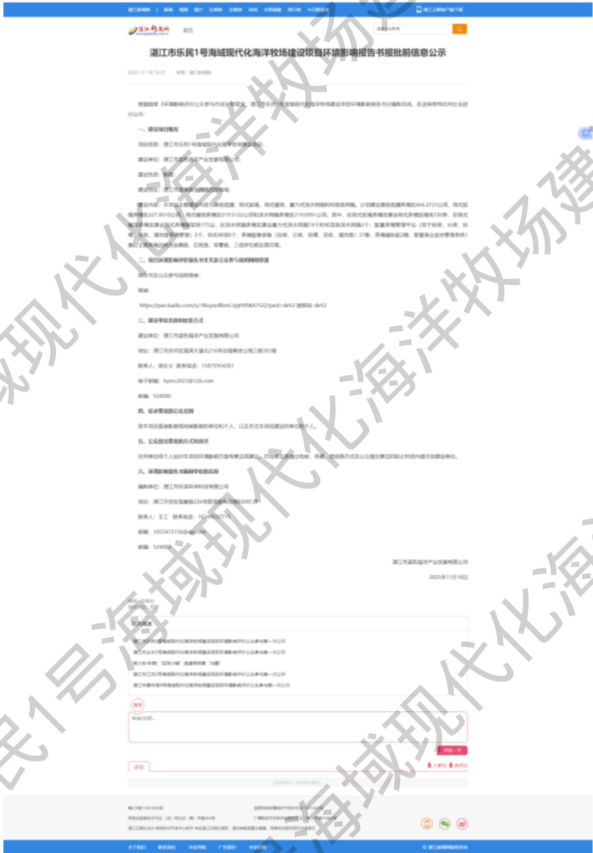
图 6-1 环评报告报批前公示环境影响评价信息公开网上截图