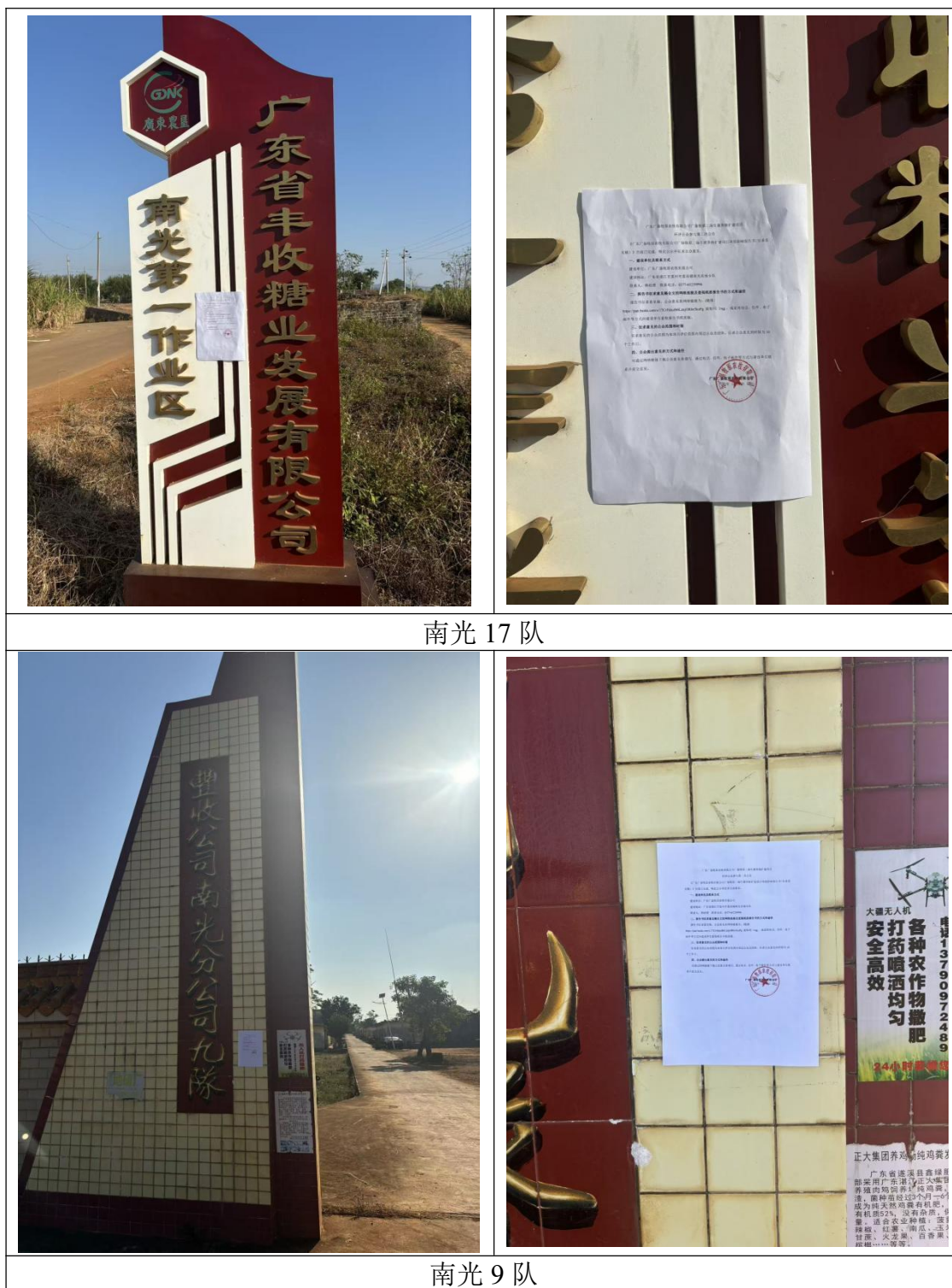
图 3.2-1 (c) 征求意见稿公示张贴照片