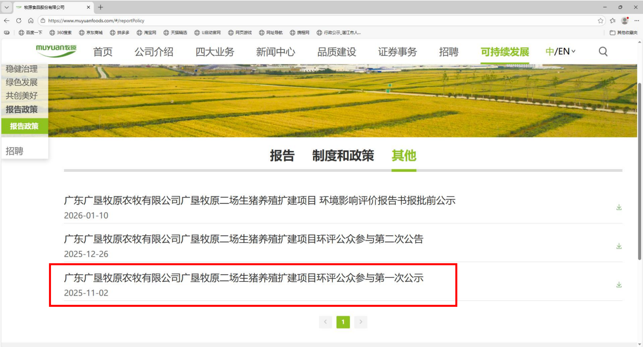
图2.2-1 官网主页面公示截图

环境影响评价信息的方式采用建设单位网站，并在确定环评编制组织单位后7个工作日内进行网站公示（委托日期：2025年11月1日，公开日期：2025年11月2日）。因此本项目首次公开环境影响评价信息的载体选取符合《环境影响评价公众参与办法》要求。