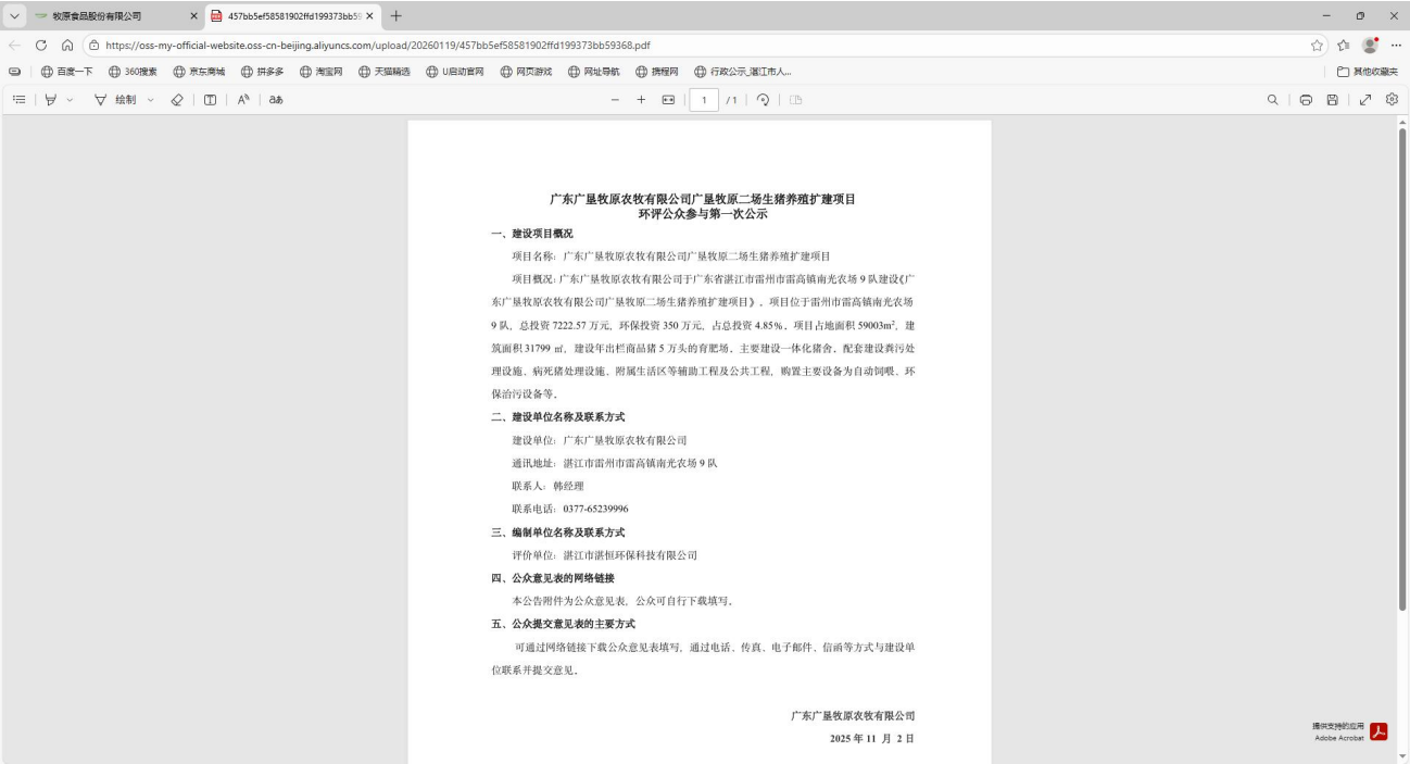
图 2.2-1 项目第一次网上公示截图