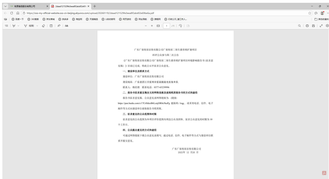
图3.2-2 征求意见稿网上公示截图