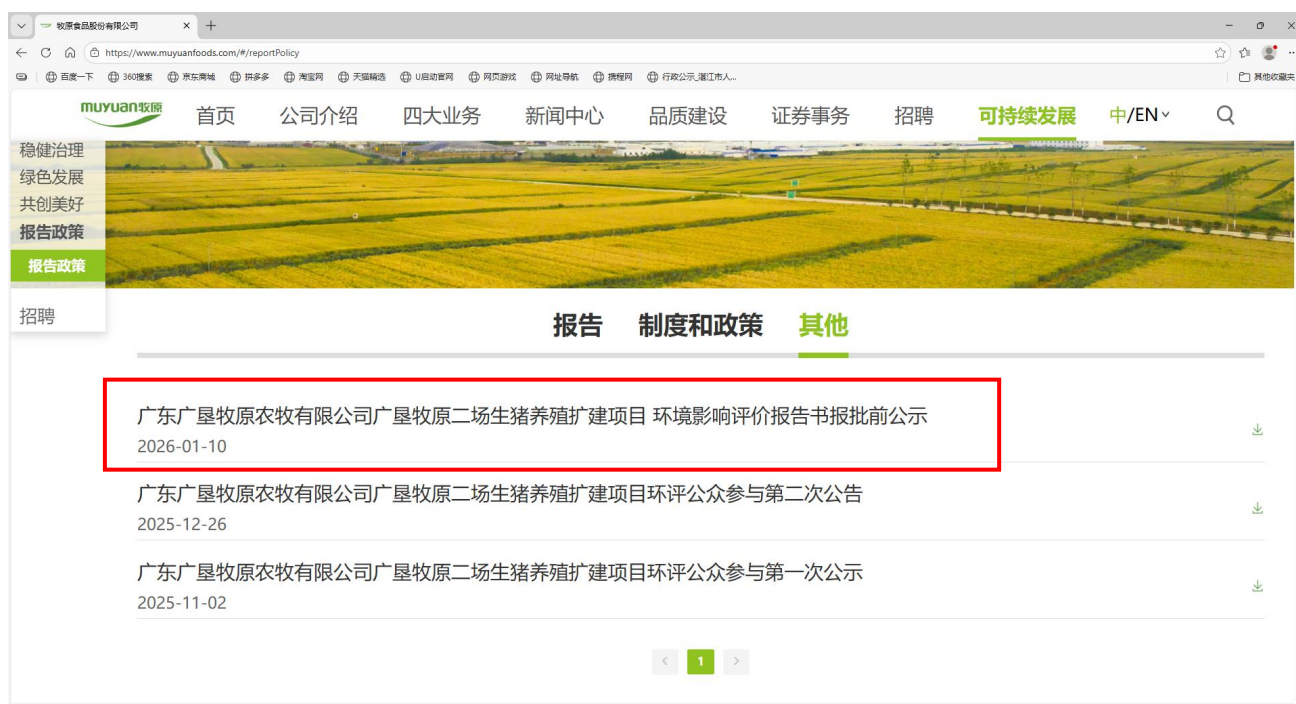
图 6.1-1 官网主页面公示截图