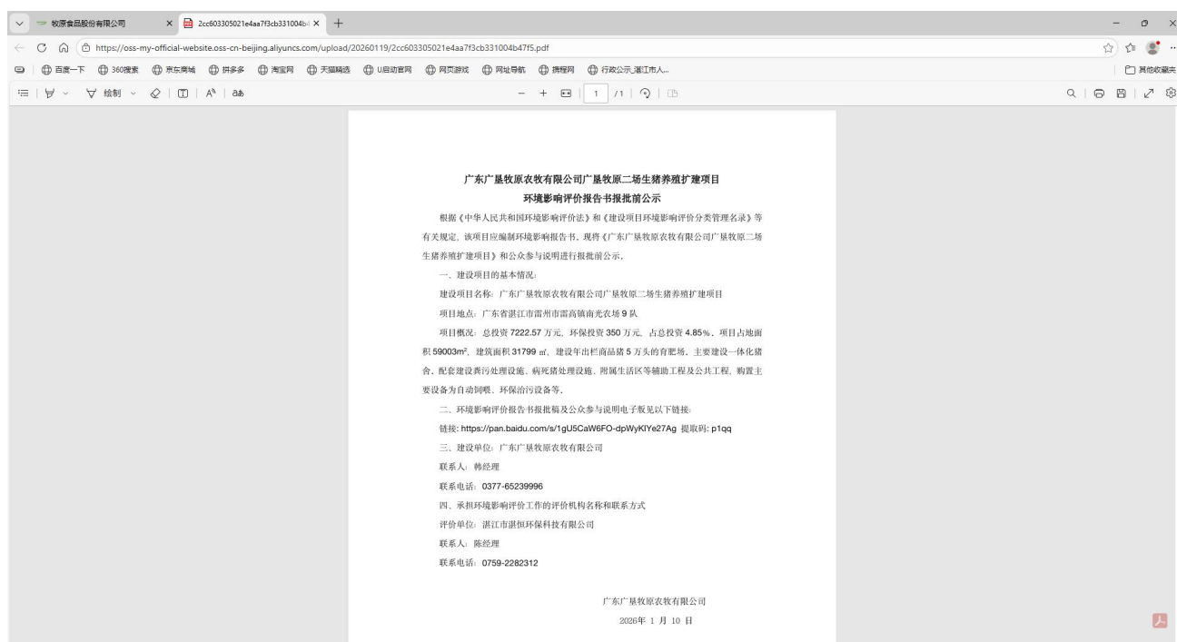
图 6.1-2 报批前公示截图