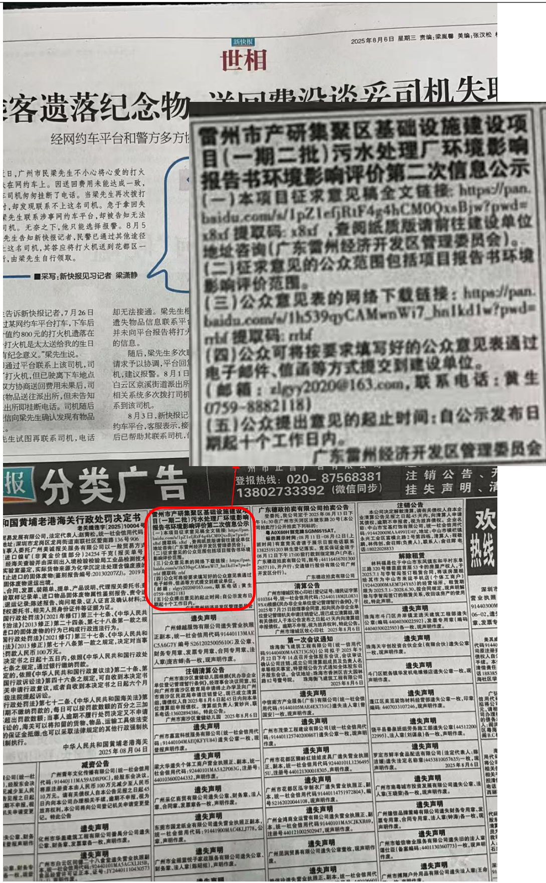
图 4-2 (1) 征求意见稿公示报纸公示照片 (第 1 次)