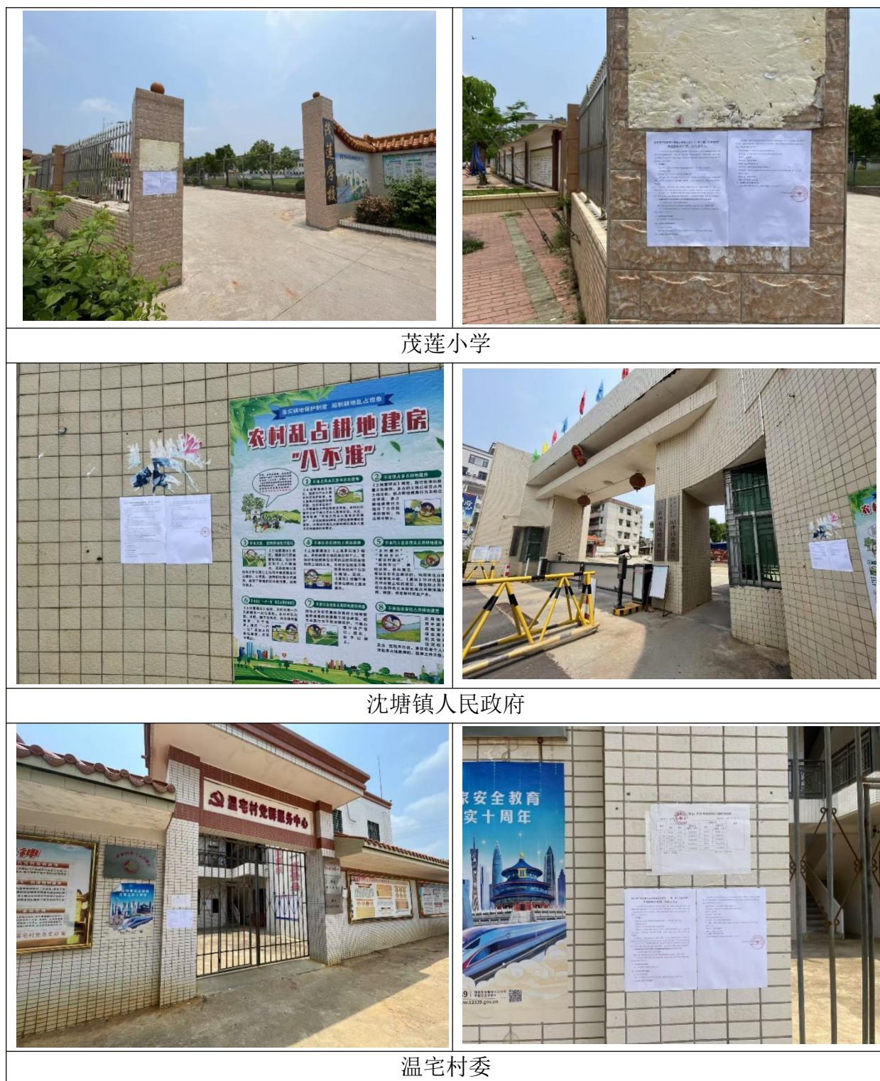
图 4-3 公众参与征求意见稿公开现场公示照片