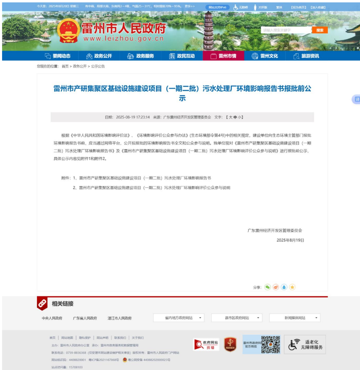
图 7-1 “报批前信息公开”网络公示截图