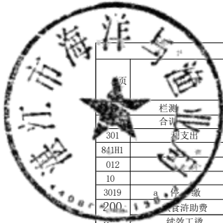
股公共预算财政拨款基本支出决算k