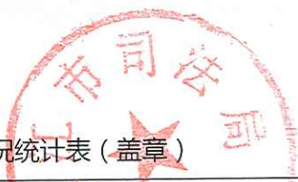
湛江市司法局2018年度行政处罚实施情况统计表 (盖章)