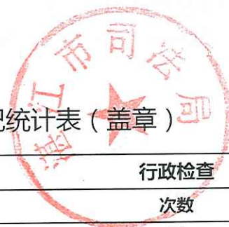
湛江市司法局2018年度行政检查实施情况统计表 (盖章)