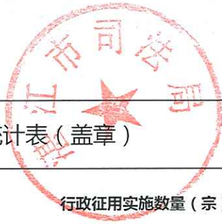
___ (部门) 2018年度行政征用实施情况统计表 (盖章)