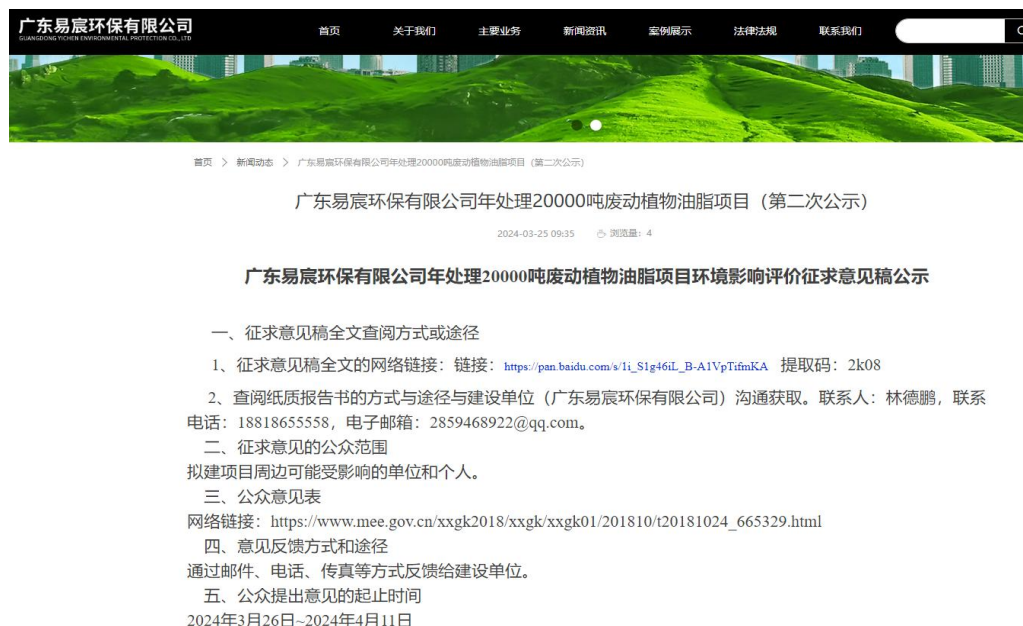
图 3 项目环评征求意见稿信息公开截图（网络平台）

https://yichenep.com/newsinfo/911493.html ，公示截图见下图 3。