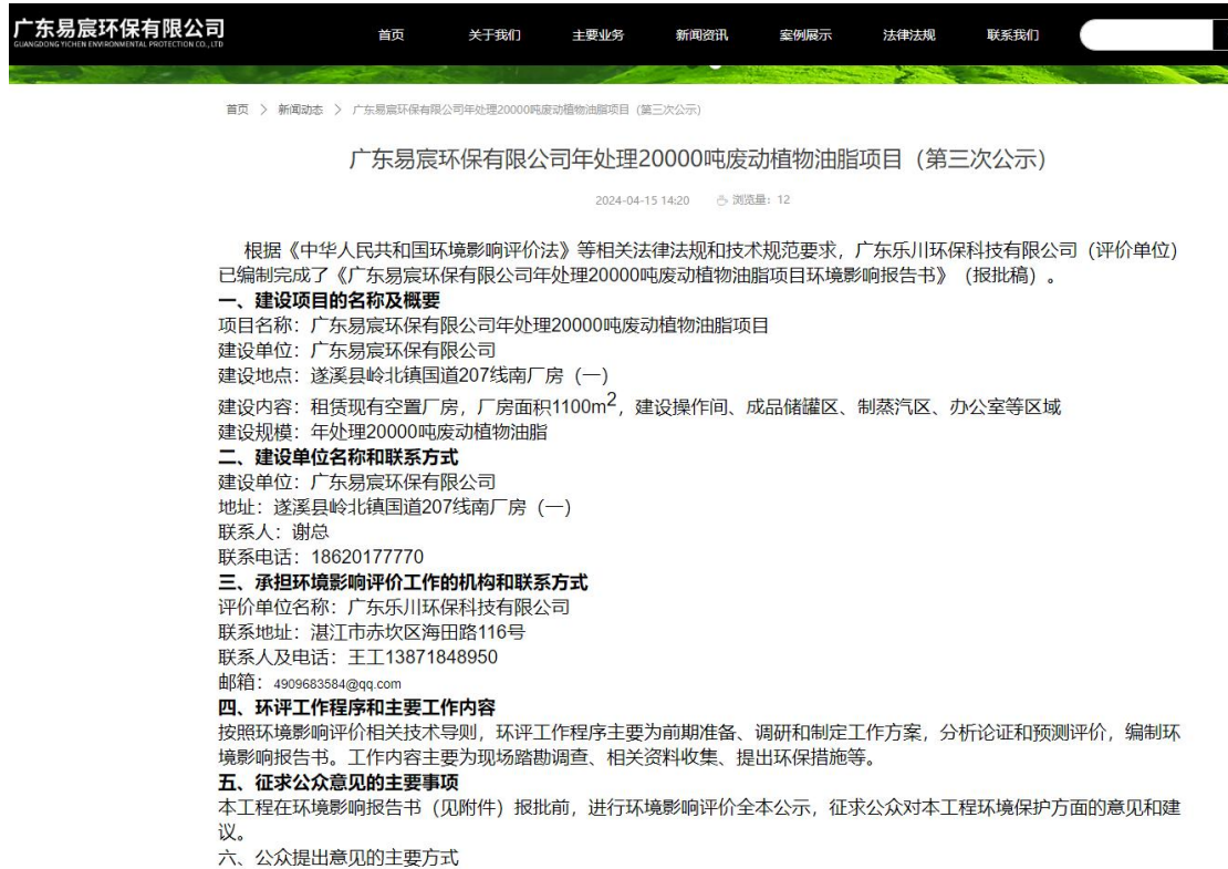
图 6 项目环评报告报批前环评信息公开截图（网络平台）

项目环评报告报批前环境影响评价信息公开选取了在建设单位广东易宸环保科技有限公司官方网站上进行，公示时间为 2024 年 4 月 15 日，网址链接为 https://yichenep.com/newsinfo/911498.html ，公示截图见下图 6。