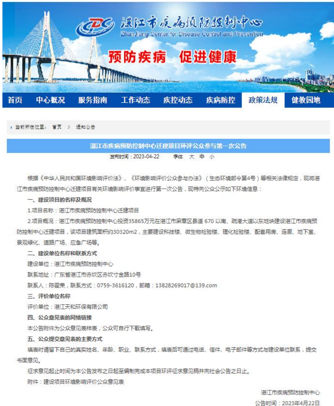
图 1 首次网络公示截图

http://www.zjcdc.cn/files/NewsHtml/e0ee9ed1-6ed0-4620-a3f4-db02c6c14796.html , 截图见下图 1。