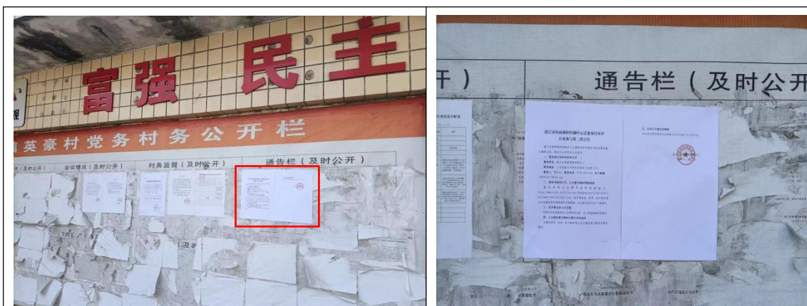
英豪村村委会张贴公告照片