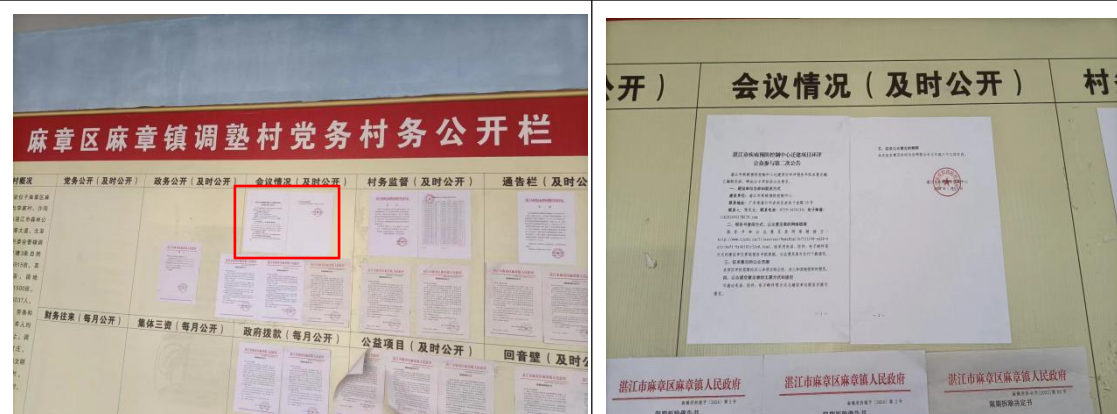
调塾村村委会张贴公告照片