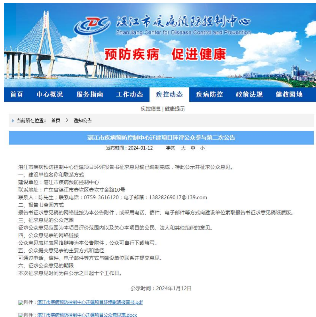
图2 征求意见稿公示截图

湛江市疾病预防控制中心迁建项目环境影响报告书征求意见稿网络公示通过湛江市疾病预防控制中心官方网站公开征求意见，湛江市疾病预防控制中心官方网站为建设单位网站，符合《环境影响评价公众参与办法》的要求。网络公示时间为2024年1月12日至2024年1月26日共10个工作日，网址为 http://www.zjcdc.cn/files/NewsHtml/b7551f48-ed28-4afc-ba91-9a46101c32e8.html ，截图见下图2。