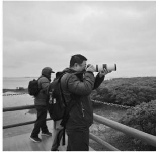
游客在特呈岛红树林拍照。

为满足人民群众高品质、多频次出游需求，广东省文化和旅游厅推出四季主题特色自驾游精品线路。冬季主题精品线路结合冬季时令特点，以温泉康养、年俗文化、节庆活动、避寒旅游等为主要推荐内容。今天为大家带来湛江篇。