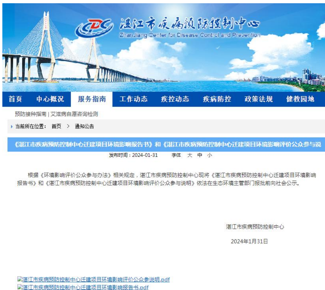
图 6 报批前公示截图