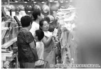
在一家文具店内,学生和家在选择文具。

文具行业业内人士称,生产企业多是中小微企业,销售渠道也多为互联网平台,市场监管带来不少新挑战。日前,国家市场监督管理总局通报2023年