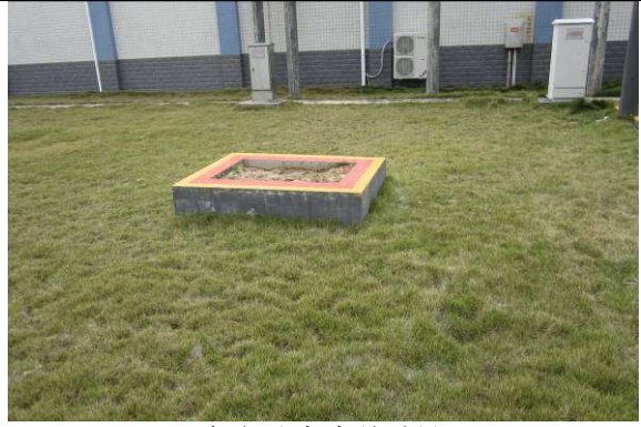
变电站内事故油池