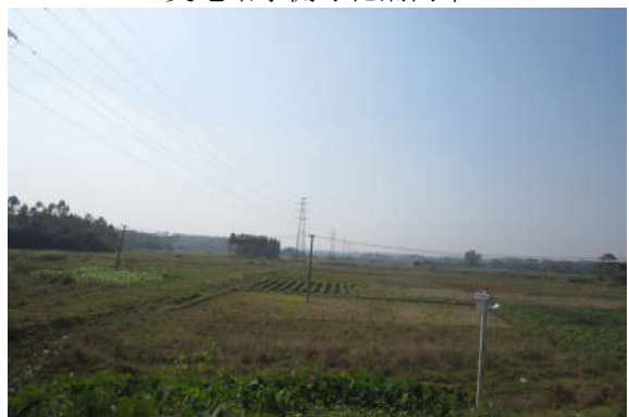
新建 110kV 线路植被恢复情况