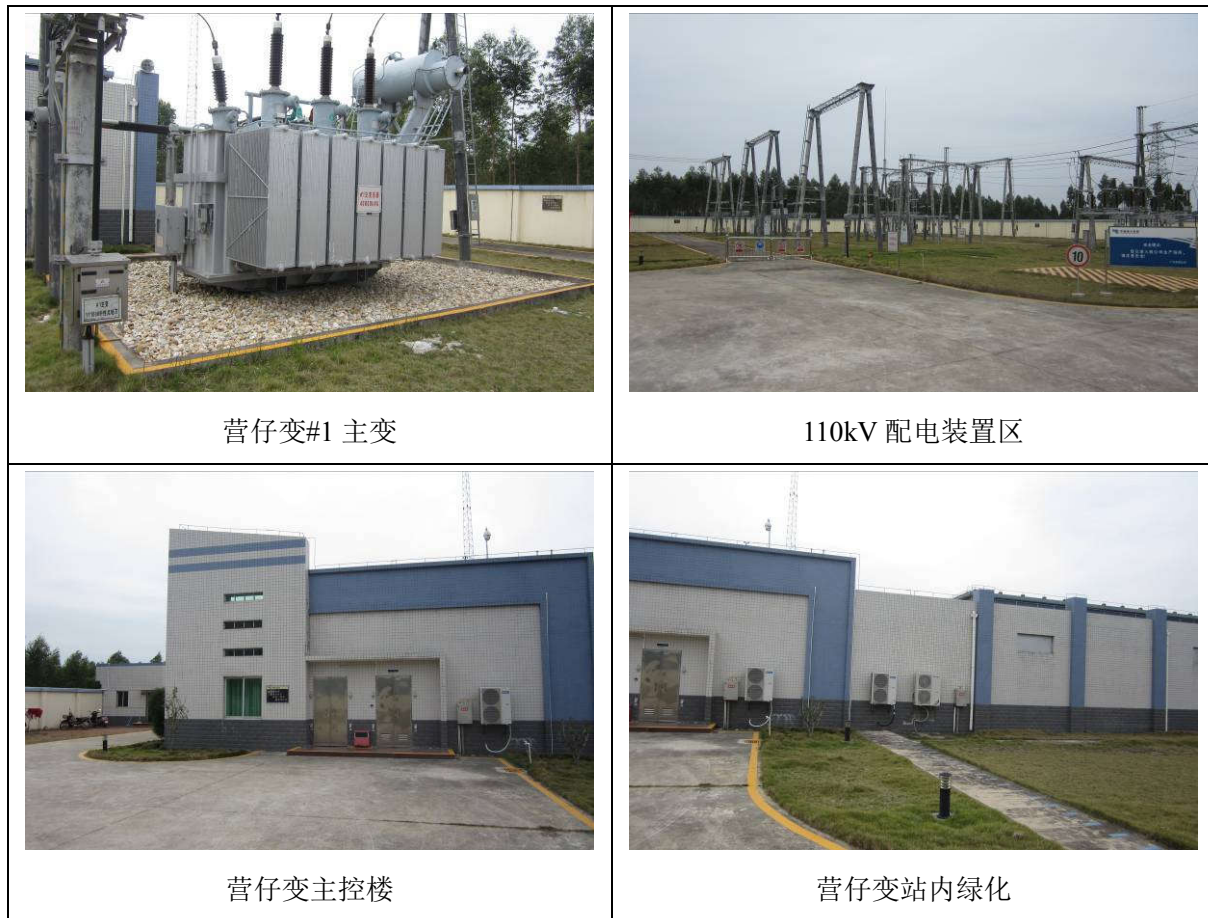
图 4-2 廉江 110kV 营仔变电站站内情况

(2) 新建 110kV 线路工程：本期新建营仔至廉江 110kV 线路，按双回设计，线路路径全长 39.62km。由于本工程线路投运时间较早，随着电网建设，其中一条至廉江 110kV 线路已被改接入 110kV 安铺变电站和 110kV 青平变电站（接入安铺变线路名称为 110kV 安营线、接入青平变线路名称为 110kV 廉青线）另一条仍然为营仔变至廉江变线路，但最初线路长度及线路路径未发生改变。