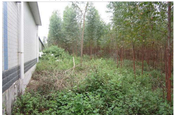
变电站东侧绿化隔离带