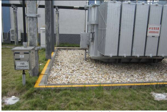
新建#1 主变及下方卵石层