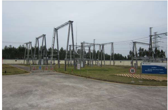
站内裸露地面均已绿化