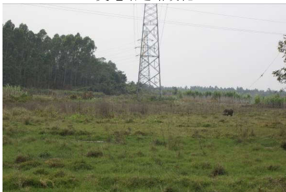
新建 110kV 线路塔基植被恢复情况