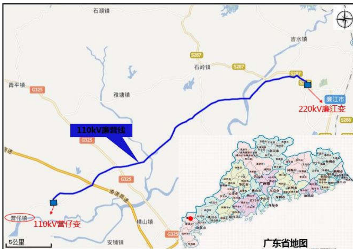
图 4-1 廉江 110kV 营仔输变电工程地理位置及路径走向图